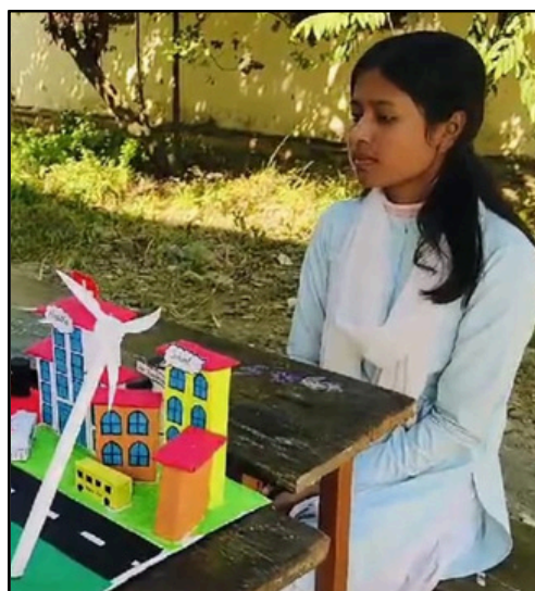
শিৱসাগৰত নেহৰু যুৱকেন্দ্ৰৰ যুৱ উৎসৱ

ই-সংবাদ, বিলাসীপাৰা, ২৬ নৱেম্বৰঃ ধুবুৰী নেহৰু যুৱ কেন্দ্ৰৰ উদ্যোগত এ ই ডি ফাউণ্ডেচন আৰু ফ্লাইহাই ইন্টিগ্ৰেটেড একাডেমীৰ সহযোগত বৰ্ণাঢ্য কাৰ্যসূচীৰে ভাৰতীয় সংবিধান দিৱস উদযাপন কৰা হয়। দিৱস উপলক্ষে ভাৰতীয় সংবিধানৰ প্ৰণেতা ড০ বি আৰ আশ্বদকাৰৰ প্ৰতিচ্ছবিত মাল্যপৰ্ণ, বস্তি প্ৰজ্বলন কৰা হয়। বিলাসীপাৰা সূৰ্যখাতাস্থিত ফ্লাইহাই ইন্টিগ্ৰেটেড একাডেমীৰ ছাত্ৰ-ছাত্ৰীসকলে বিদ্যালয়খনৰ পৰা ড০ বি আৰ আশ্বদকাৰৰ ভৱনলৈ শোভাযাত্ৰা উলিয়ায়। কাৰ্যসূচীত ধুবুৰী নেহৰু যুৱ কেন্দ্ৰৰ বিষয়ববীয়া আৰু ফ্লাইহাই ইন্টিগ্ৰেটেড একাডেমীৰ শিক্ষক-শিক্ষয়িত্ৰীসকল উপস্থিত থাকে।