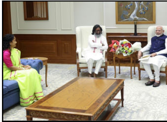
প্ৰধানমন্ত্ৰীক সাক্ষাৎ হেমন্ত ছোৰেনৰ

ই-সংবাদ, ২৬ নৱেম্বৰঃ আন নেতাসকলৰ দৰে অসম প্ৰদেশ কংগ্ৰেছ কমিটিৰ সভাপতি ভূপেন কুমাৰ বৰাৰ শেষাংশ ৫ পৃষ্ঠাত