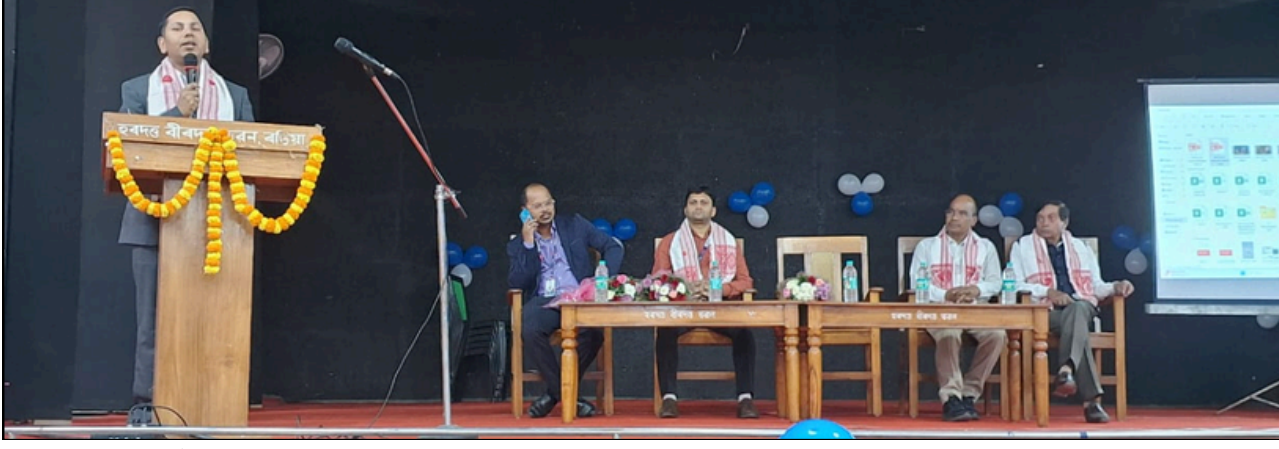
ৰঙিয়াত অনুষ্ঠিত এছবিআইৰ ডিজিটেল মাধ্যমৰ ব্যৱহাৰিক গ্ৰাহক সজাগতা সভাৰ এটি মুহূৰ্ত, ফটো: ই-সংবাদ, ৰঙিয়া

দেখিও নেদেখাৰ ভাও শিক্ষা বিভাগৰ, বিপদত শতাধিক শিক্ষার্থী